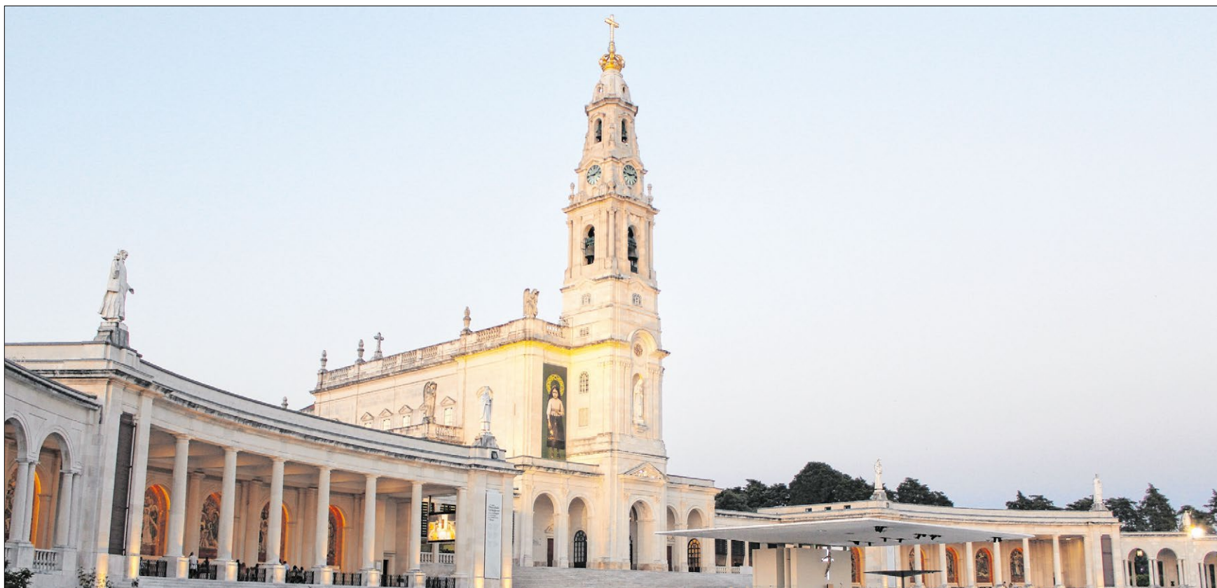
▲ Die Basilika Unserer Lieben Frau vom Rosenkranz im Abendlicht. Sie wurde von 1928 an gebaut und 1953 geweiht.