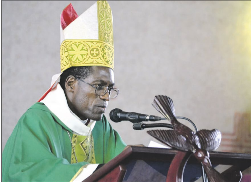
▲ Jean-Marie Balla: Der Bischof von Bafia wurde am 2. Juni tot aufgefunden. Offiziell beging er Suizid. Die Kirche vermutet Mord.

In der Lunge des Toten sei „kein Tropfen Wasser“ gefunden worden, berichteten Medien. Auch habe man Spuren von Gewaltausübung an der Leiche entdeckt. Der Bischof, so