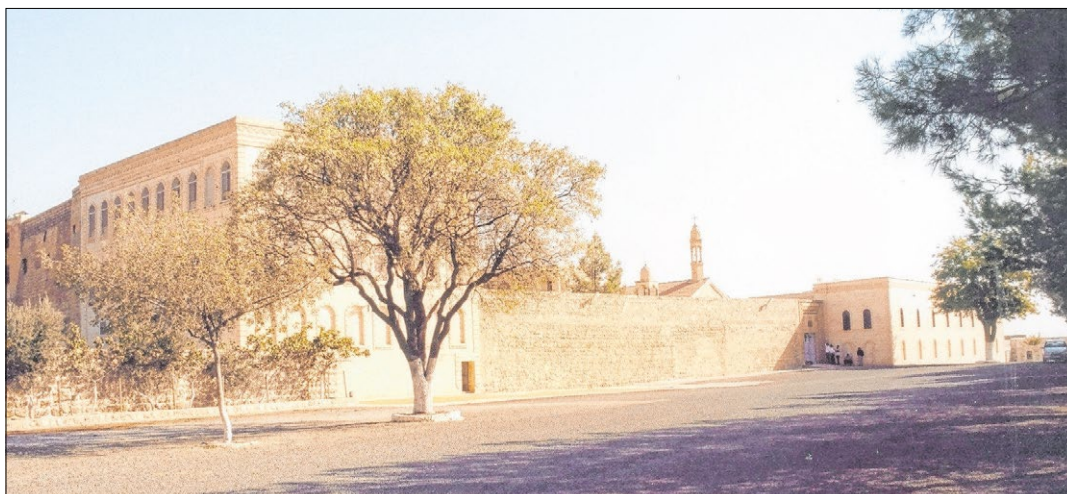
◀ Mor Gabriel im Südosten der Türkei. Der Streit um das Kloster – eines der ältesten der Welt – steht sinnbildlich für die schwierige Lage der christlichen Minderheit in der Türkei.

Zu den betroffenen Gebäuden zählt auch Mor Gabriel, eines der ältesten christlichen Klöster überhaupt. Es stammt aus dem Jahr 397 nach Christus und gehört zum Welterbe der Unesco. Dass die Ent-