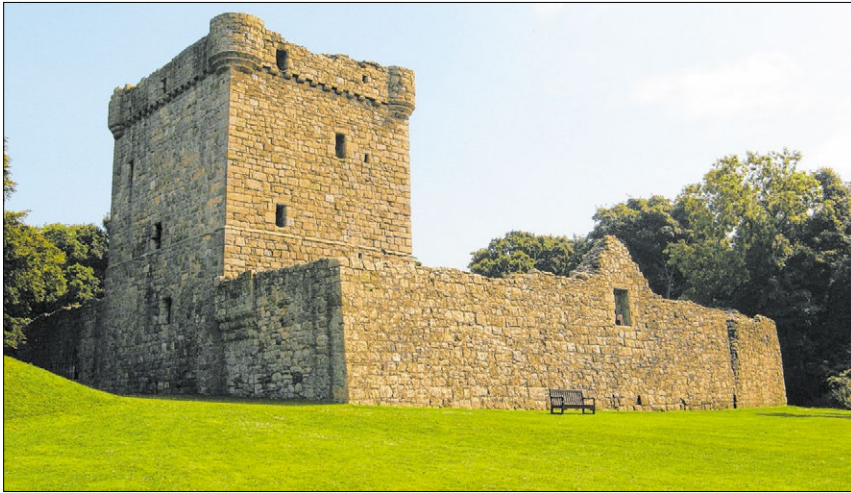
▲ Von Maria Stuarts Gefängnis Lochleven Castle ist heute nur eine Ruine übrig.