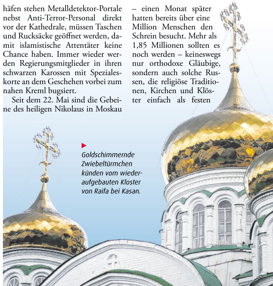
► Goldschimmernde Zwiebeltürmchen künden vom wieder aufgebauten Kloster von Raifa bei Kasan.

– einen Monat später hatten bereits über eine Million Menschen den Schrein besucht. Mehr als 1,85 Millionen sollten es noch werden – keineswegs nur orthodoxe Gläubige, sondern auch solche Russen, die religiöse Traditionen, Kirchen und Klöster einfach als festen