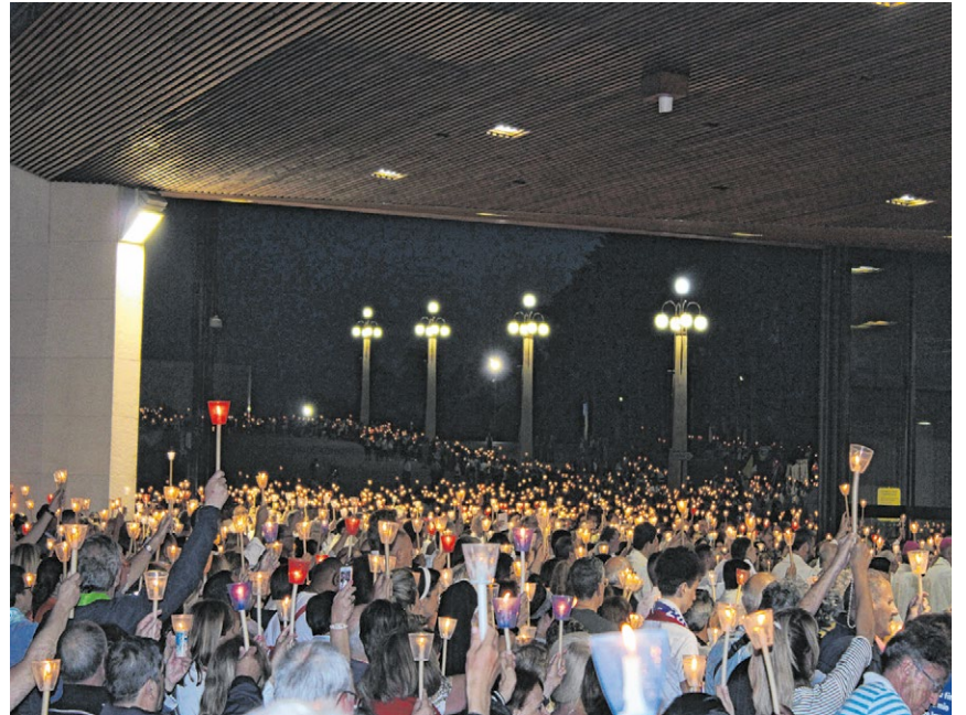
▲ Jeden Abend findet in der Erscheinungskapelle eine Rosenkranzandacht mit anschließender Lichterprozession statt.