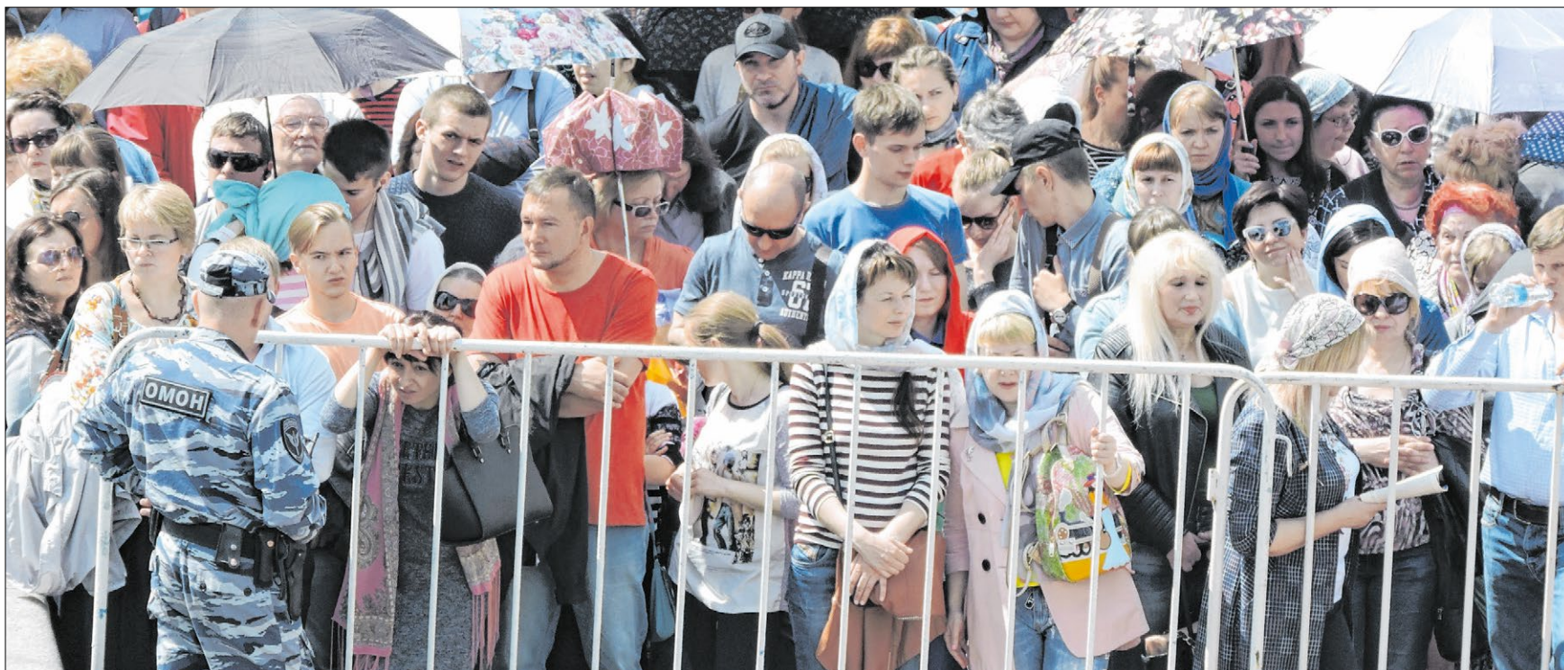
▲ Beamte der Antiterrorereinheit Omon schützen die Pilger, die in Moskau zum Schrein des heiligen Nikolaus strömen.