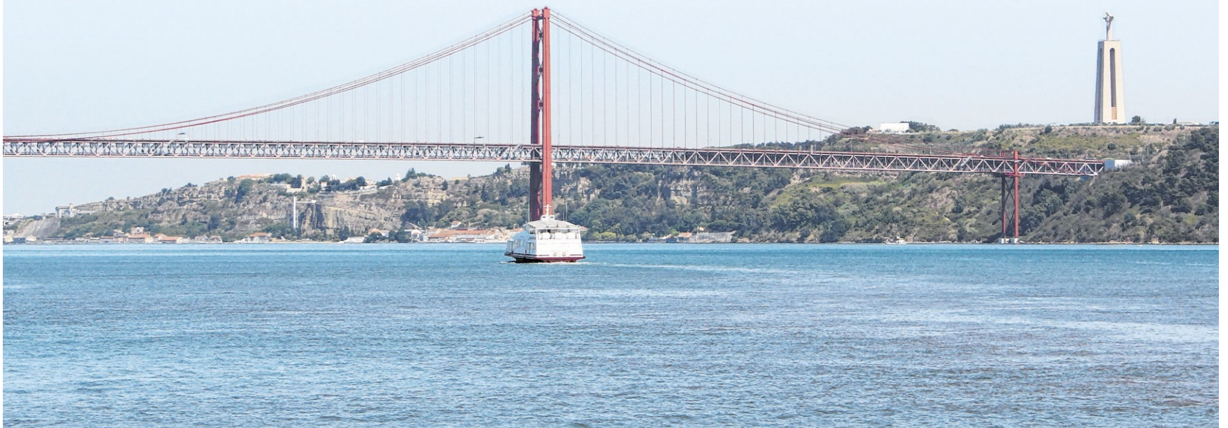
▲ Blick vom Ufer des Tejo auf die Brücke des 25. April. Benannt ist sie nach dem Anfangsdatum der Nelkenrevolution 1974. Sie hat große Ähnlichkeit mit der Golden Gate Bridge in San Francisco. Über dem gegenüberliegenden Ufer erhebt sich die Cristo-Rei-Statue.