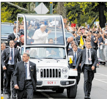
▲ Bei seinen Papamobilen wünscht sich Papst Franziskus keinen Luxus.