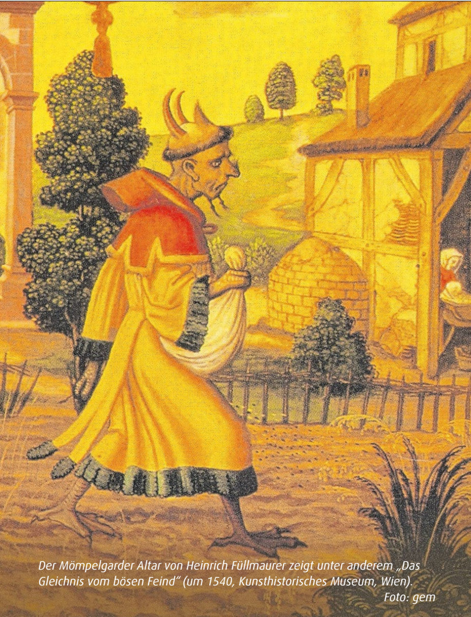
Der Mompelgarder Altar von Heinrich Füllmaurer zeigt unter anderem „Das Gleichnis vom bösen Feind“ (um 1540, Kunsthistorisches Museum, Wien).