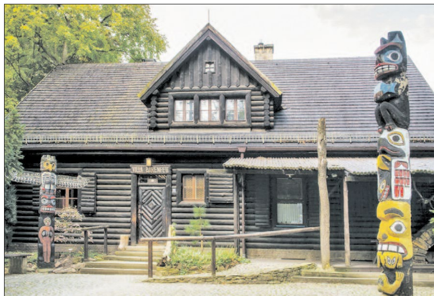
▲ Die „Villa Bärenfett“ in Radebeul.