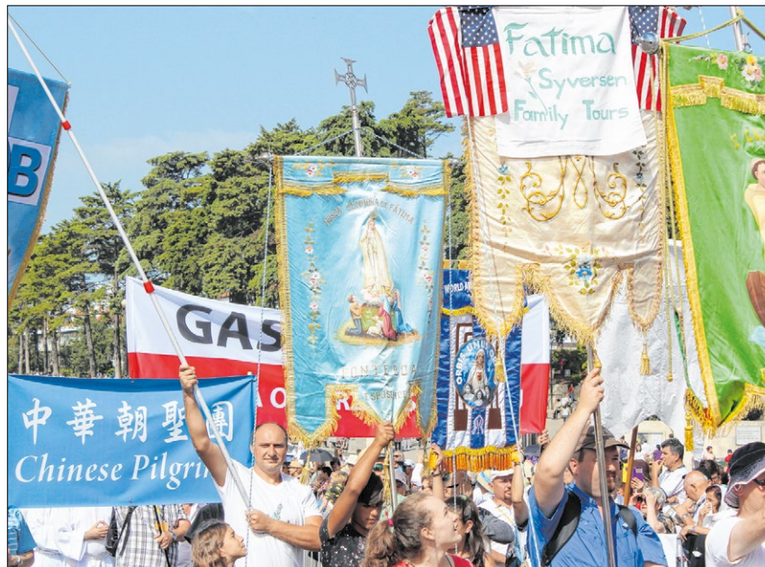
▲ Aus aller Herren Länder strömen die Pilger nach Fátima, um gemeinsam zu beten und die Heilige Messe zu feiern.

Damit die Menschheit sich zu Gott bekehrt, trug die Gottesmutter den Kindern bei allen sechs Erscheinungen auf, täglich den Rosenkranz zu beten. In diesem Geist findet an der Erscheinungskapelle jeden Abend ein Rosenkranzgebet mit anschließender Lichterprozession über den großen Platz statt. Die einzelnen Abschnitte werden teilweise auf Portugiesisch, teilweise in den Landessprachen der Pilger vorgebetet. Jeder antwortet dann in seiner Sprache.