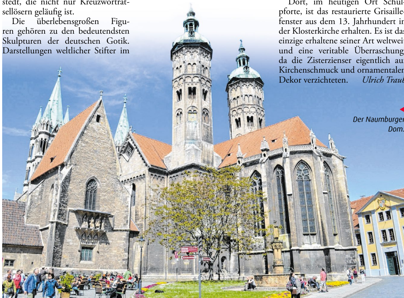
Der Naumburger Dom.

Chor einer Kirche – das gab es in jener Zeit sonst nirgends. Sie befinden sich im Westchor hinter einem Lettner mit Passionsreliefs und Kreuzigungsgruppe. Auch das ein Werk des Naumburger Meisters. Eine weitere Besonderheit: Die gegenüberliegende Chorschranke von 1230 zählt zu den ältesten romanischen Hallenlettner weltweit.