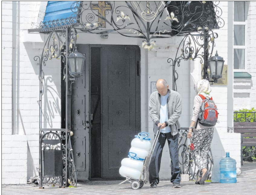
▲ Orthodoxe Frömmigkeit: Im Kloster Raifa füllen Gläubige das Weihwasser kanisterweise ab, um es mit nach Hause zu nehmen.

„Ein bedeutendes kulturelles Ereignis“, zeigte sich auch der russisch-orthodoxe Patriarch Kyrill I. erfreut. „Man sieht: Die Zusammenarbeit mit der römisch-katholischen Kirche wird enger!“ Dass die Gebeine des heiligen Nikolaus erstmals nach Russland ausgeliehen wurden, nennt Kyrill I. „ein