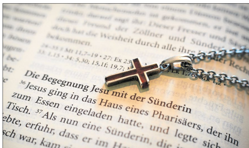
▲ Wegen einer Kreuzkette, die er um seinen Hals trug, wurde ein 39-Jähriger in Berlin von mutmaßlich nordafrikanischen Tätern angegriffen (Symbolbild).