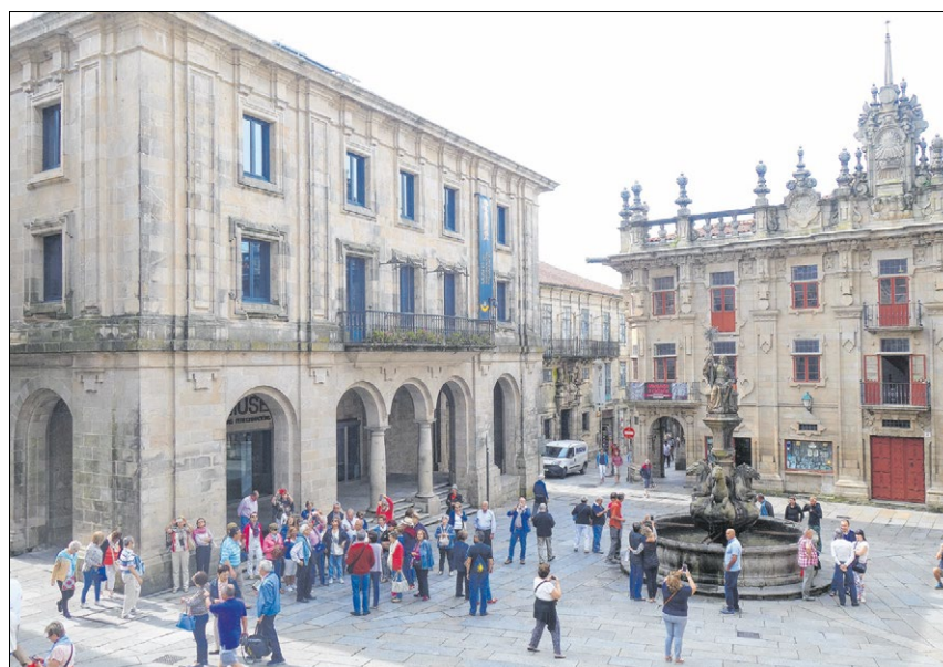
▲ In diesem Gebäude (links) am südlichen Vorplatz der Kathedrale von Santiago de Compostela ist das Pilgermuseum untergebracht.