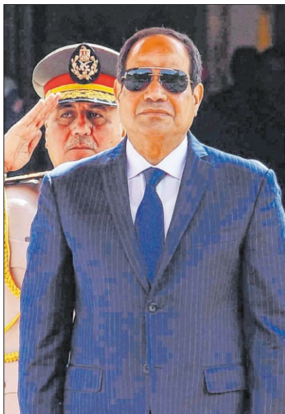
▲ Ägyptens Präsident Abdel Fattah al-Sisi kann die Christen des Landes nicht ausreichend schützen.