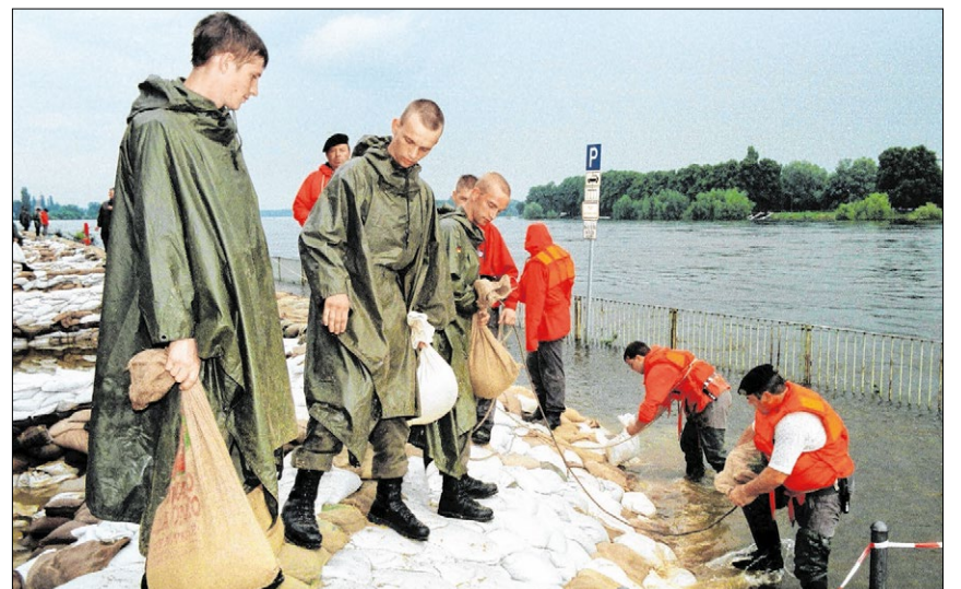
▲ Kampf gegen das Hochwasser 1997: Soldaten der Bundeswehr und Mitglieder des Technischen Hilfswerkes verstärken einen Damm bei Frankfurt an der Oder mit Sandsäcken.