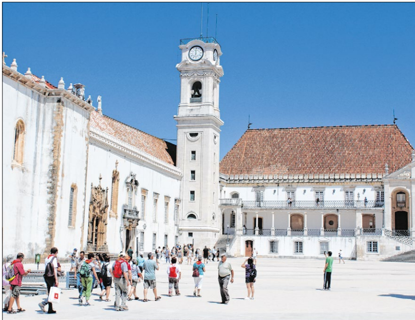
▲ Der Hof der alten Universität von Coimbra mit dem markanten „Ziegenturm“. Das Gebäude zur Rechten beherbergt bis heute die Juristische Fakultät.

ihn die Welt heutzutage vor allem als Antonius von Padua. Doch wir Portugiesen werden sehr böse, wenn man ihn so nennt.“