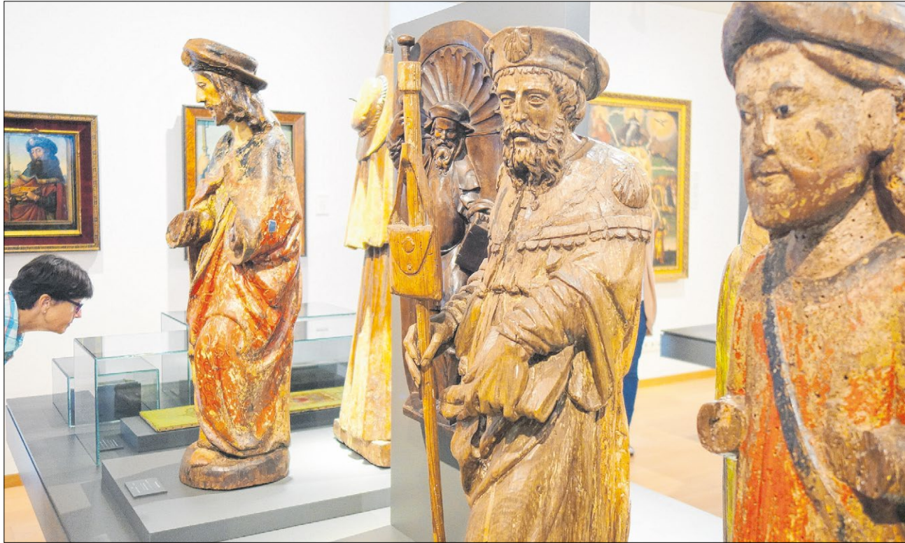
▲ Die Sammlung der Apostelskulpturen lädt zur näheren Betrachtung ein.

Geheimtipp: Pilgermuseum von Santiago zeigt Jakobus in allen Formen und Größen